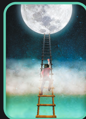
ACREDITAR código 241002