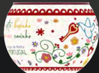
LENÇOS DO MINHO K1120