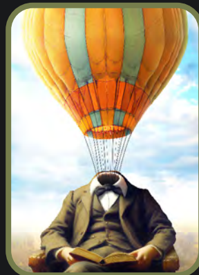
VOANDO COM IDEIAS código 241003