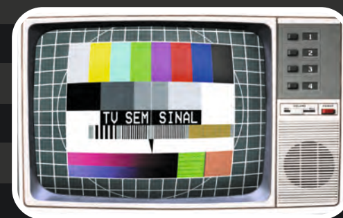
MIRA TÉCNICA código 241051