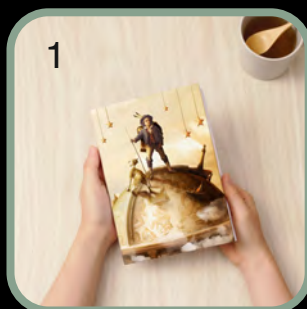
1 PEQUENO EXPLORADOR YA1054