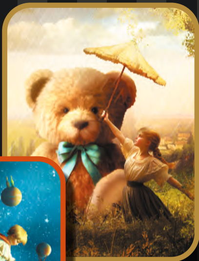
O MEU URSINHO GIGANTE código 241202