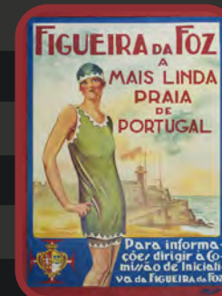
CARTAZ FIGUEIRA código 241054