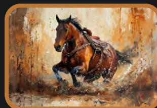
SELVAGEM código 241004