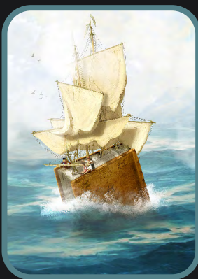
VIAJANTE DE HISTÓRIAS código 241006