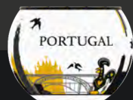
MONUMENTOS DE PORTUGAL K1121